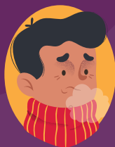
İy və dadbilmənin müvəqqəti itirilməsi

Bu xəstəliyə yoluxma laborator analizlərlə müəyyən edilir.