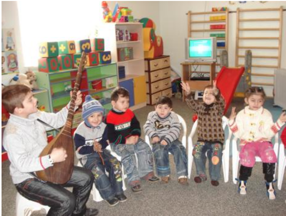
(“Mingəçevir uşaq və ailələrə dəstək mərkəzi” ndən görüntülər)

Təhsil Nazirliyinin tabeliyində ilk fəaliyyətə başlayan mərkəz “Mingəçevir uşaq və ailələrə dəstək mərkəzi” olmuşdur. Mərkəz “Uşaqların Xilas” təşkilatı tərəfindən yaradılmış, Nazirlər Kabinetinin 31s nömrəli, 5 fevral 2009-cu il tarixli Sərəncamına əsasən Təhsil Nazirliyinin tabeliyinə verilmişdir. Mərkəz sağlamlıq imkanları məhdud uşaqlara günərzi və reabilitasiya xidmətlərini göstərməklə yanaşı, risk qrupuna daxil olan, müəssisəyə düşmək riski qarşısında olan uşaqlar və onların ailələri ilə profilaktik iş aparır. Onlara psixoloji dəstək, valideyn bacarıqlarının artırılması və hüquqi müvəkkillik kimi xidmətlər göstərilir. Bu mərkəzin göstərdiyi xidmətlərin nəticəsidir ki, Mingəçevirdən 1 il ərzində yalnız 1 uşaq çətin tərbiyə-olunan uşaqlar üçün müəssisəyə yerləşdirilmişdir. Sağlamlıq imkanları məhdud 45 uşaq mərkəzin günərzi və reabilitasiya xidmətlərindən istifadə edir.