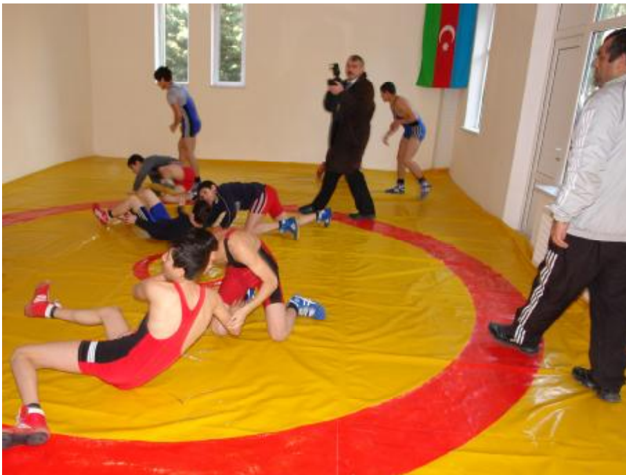
(2 nömrəli Uşaq evinin bazasında yaradılmış Suraxanı rayonu “Günərzi qayğı mərkəzi”ndən görüntülər)