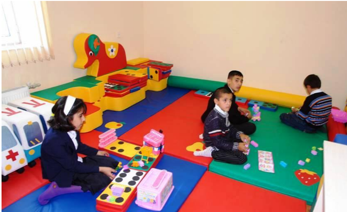
(Saęlamlıq imkanları məhdud valideyn himayəsindən məhrum olmuş uşaqalar üçün 4 nömrəli Respublika xüsusi internat məktəbinin nəzdində “Reabilitasiya – inkişaf mərkəzi”ndən görüntülər)

Məktəbyaşlı uşaqaların (1-8-ci siniflərarası) mərkəzdə dərstdən sonrakı asudə vaxtlarının səmərəli təşkili də nəzərdə tutulmuşdur. Uşaqaların axşam nəqliyyat vasitəsilə evlərinə aparılması mərkəz tərəfindən təmin edilir. Bu məqsədlə mərkəzə proqram çərçivəsində Təhsil Nazirliyi tərəfindən mini sərnişin avtobusu verilmişdir. Mərkəzdə uşaqaların gүн ərzində 2 dəfə qidalanması və ehtiyac yaranarsa, ilk tibbi yardım xidmətinin göstərilməsi, habelə, işçilərin bacarıqlarının artırılması məqsədilə mütəmadi trening və seminarların keçirilməsi nəzərdə tutulmuşdur.