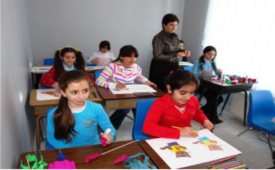
(2 nömrəli Uşaq evinin bazasında yaradılmış Suraxanı rayonu “Günərzi qayğı mərkəzi”ndən görüntülər)

Maraq və bacarıqlarına əsasən uşaqlar mərkəzdə yaradılmış müxtəlif dərnlərə (güləş, bacarıqlı əllər, rəqs, rəsm, kompyuter yazılır) cəlb olunurlar. Mərkəzin işçiləri, uşağı dərindən sonra təhsil aldığı məktəbdən mərkəzə gətirir. Uşaqların axşam nəqliyyat vasitəsilə evlərinə aparılması mərkəz tərəfindən təmin edilir. Bu məqsədlə mərkəzə proqram çərçivəsində Təhsil Nazirliyi tərəfindən mini sərnişin avtobusu verilmişdir. Mərkəzin fəaliyyətə başladığı vaxtdan bugünədək Suraxanı rayonu ərazisindən cəmi 3 uşaq (bir ailədən olan və valideynlərini itirmiş) dövlət uşaq müəssisəsinə gecələmək şərti ilə yerləşdirilmişdir.